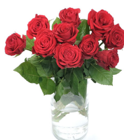
Behandlade rosor efter 14 dagars i rumstemperatur