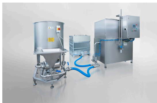
OptiCept™ Vakuumpregneringsmaskin (VI)

För snittblommor erbjuder vi avtal som innebär ett totalt rörligt pris per behandling; OptiCept™, OptiCap™ tillsatser och royalty ingår då i totalpriset. Dessa avtal har en minimivolym.