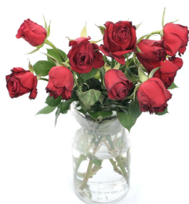
Obehandlade rosor efter 14 dagars i rumstemperatur

teknologi öppnar upp nya affärsmöjligheter för livsmedels- och växtförökningsindustrin över hela världen. Bolaget grundades 2011 av LU Innovation, flertalet forskare på Department of Food Technology på Lunds Universitet och ArcAroma AB (publ).