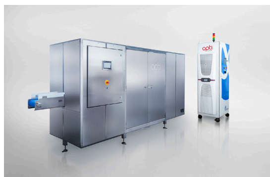
OptiCept™ Pulsed Electric Field (PEF)

OptiFreeze erbjuder två produkter, OptiCept™-processsystem och OptiCap™-ingredienser. I OptiCept™ sker själva behandlingen av produkterna exempelvis grönsaker, frukt, bär, plantor, snittblommor och örter. Under processen tillsätts OptiCap™ som innehåller naturligt socker och tillsatser som vitaminer. OptiFreeze-metoden kan användas på ett brett urval av produkter indelade i fyra olika applikationsområden, OptiFresh, OptiFreeze, OptiDry samt OptiFlower.