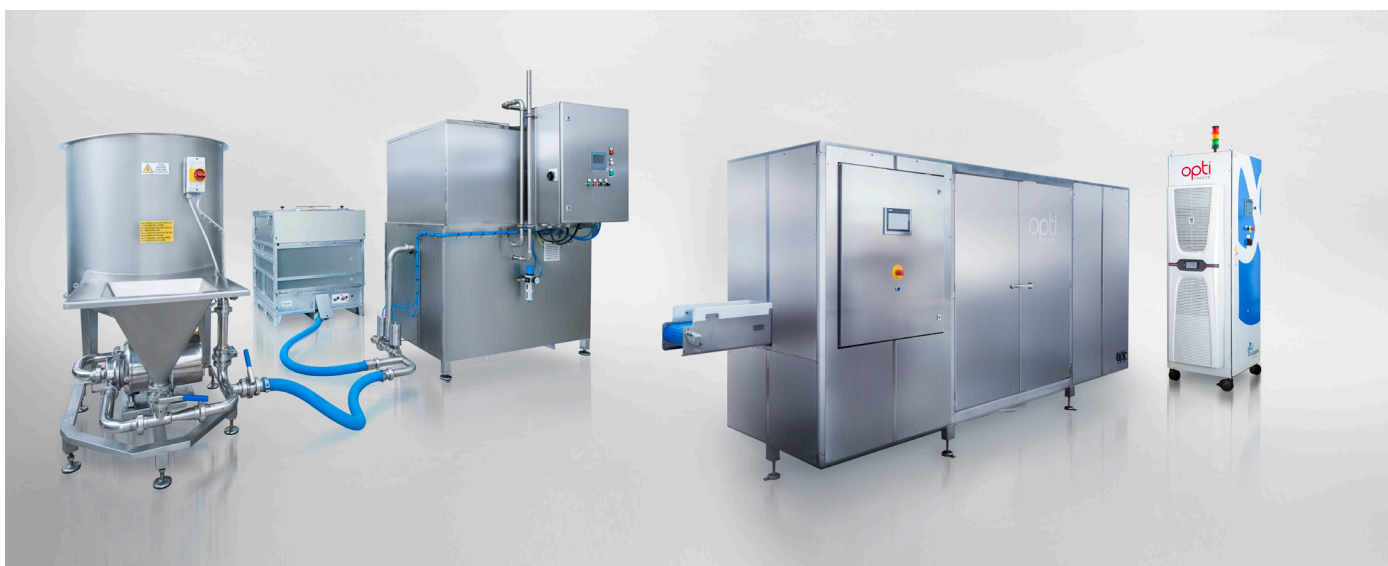
OptiCept™, vakuumimpregneringsmaskin (VI) och PEF-maskin (Pulsed Electric Field)

Bolaget grundades 2011 av LU Innovation, flertalet forskare på Department of Food Technology på Lunds Universitet och ArcAroma AB (publ).